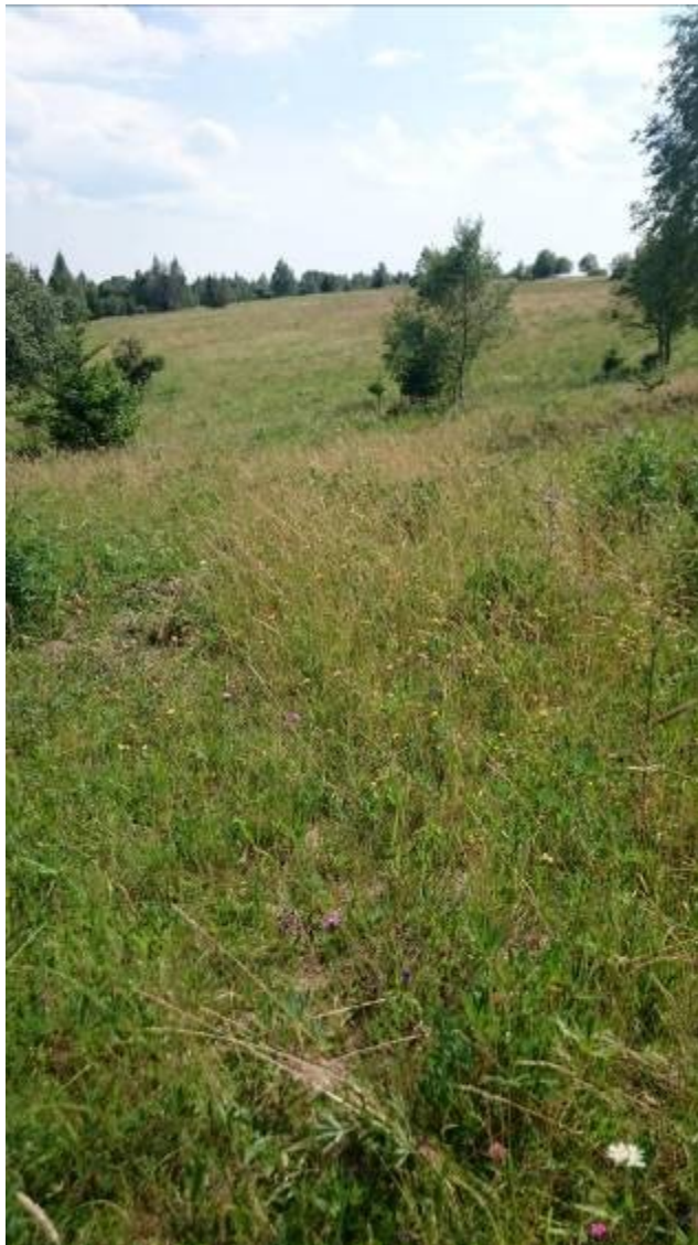
Plocha 4 s mateřídouškou