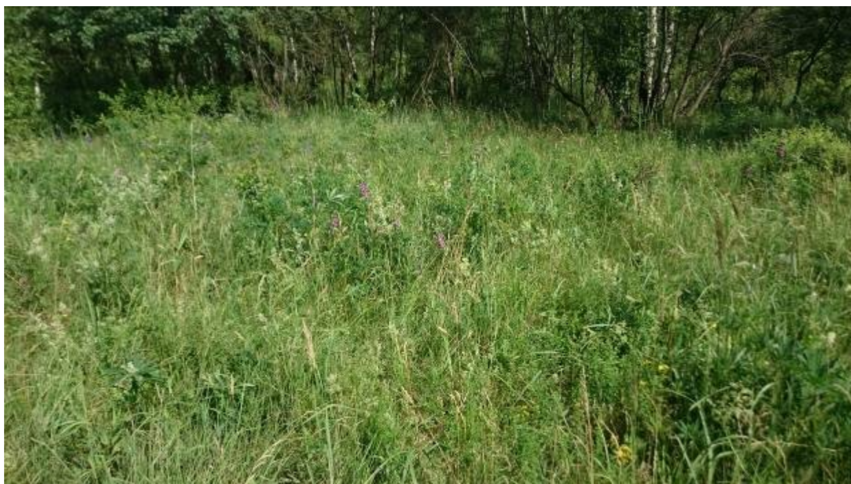
Plocha 3 s mečíkem