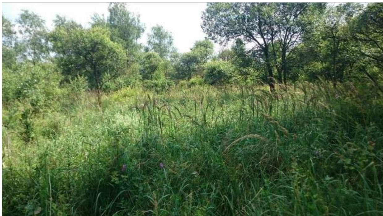
Plocha 3 s nálety vrb