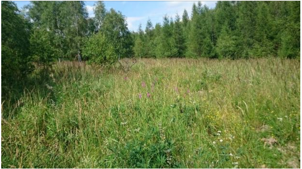
Přechod mezi plochou 3 a 4