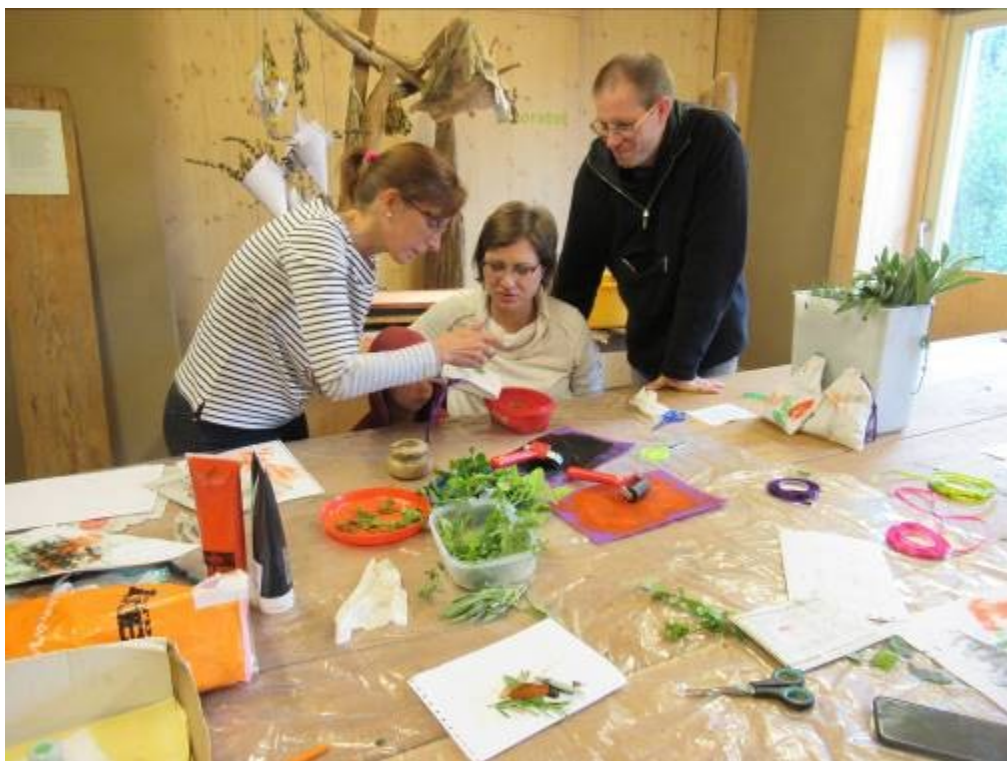
Stanoviště – využití bylin k potisku ručním lisem na plátěné sáčky.