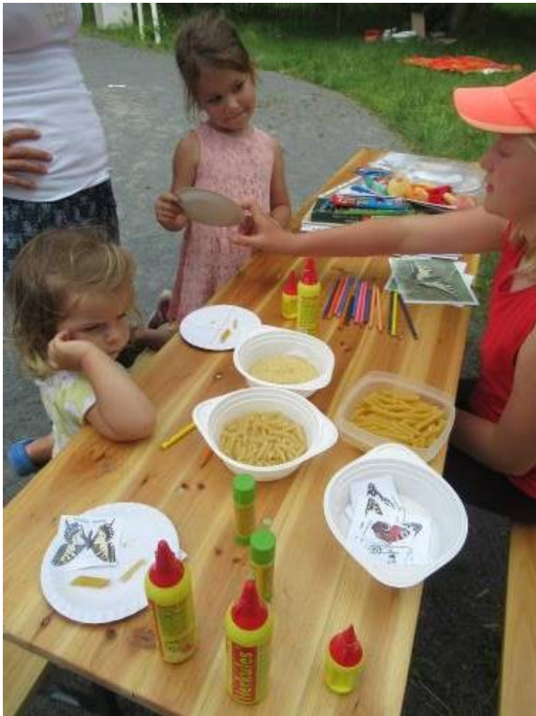
Stanoviště – výroba životního cyklu motýlů.