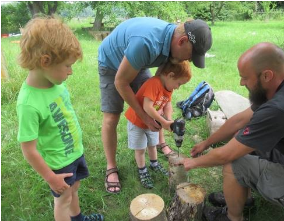
Vrtání komůrek do pařezů pro včely samotáčky.