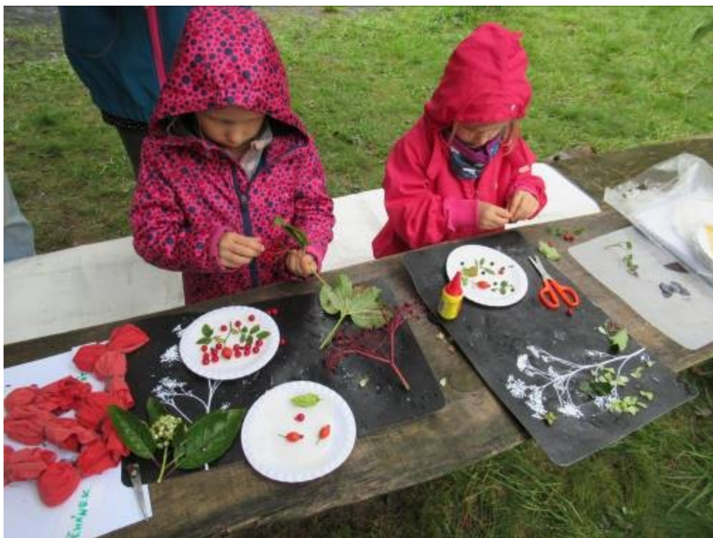
Výtvarná dílna – listy a plody našich keřů.