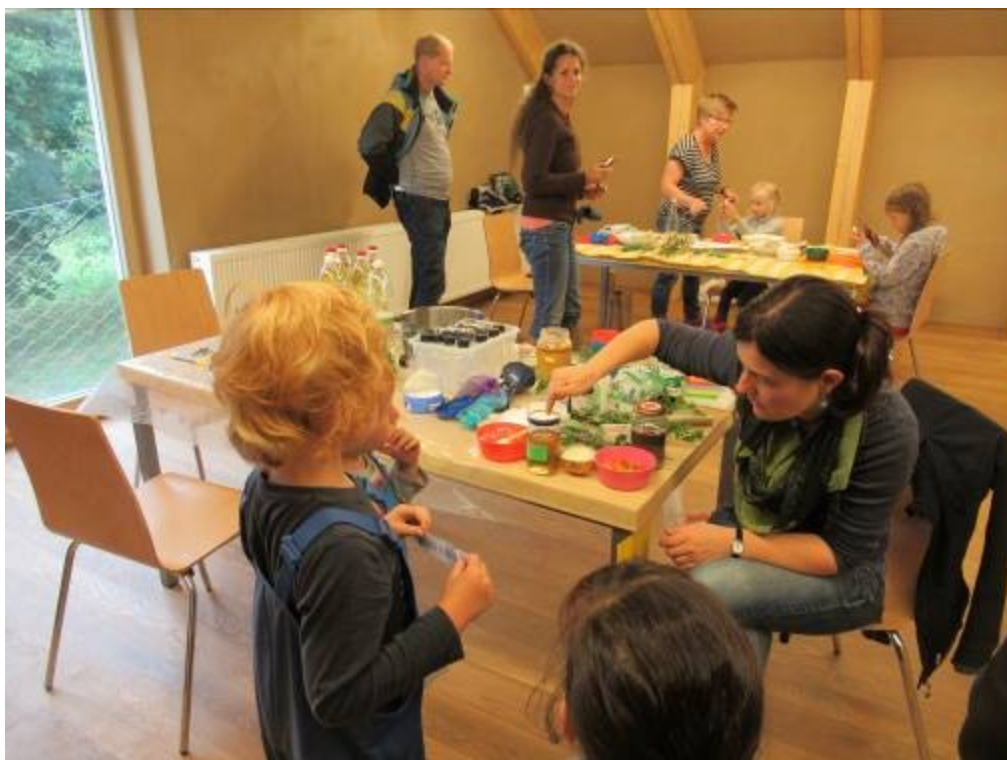
Stanoviště byliny – výroba repelentu a bylinková lékárna s vařením čaje.