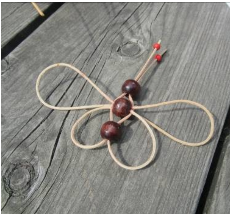
Vyrobený motýl z pedigu.