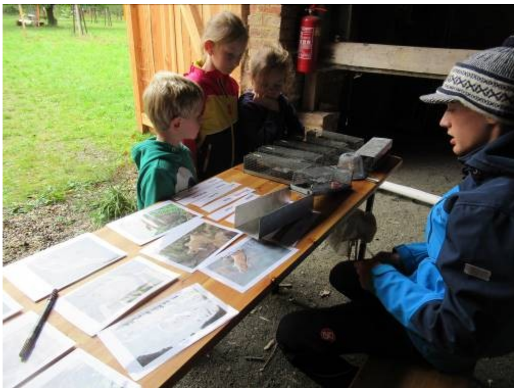
Prezentace odchyty drobných savců do živolvných pastí.