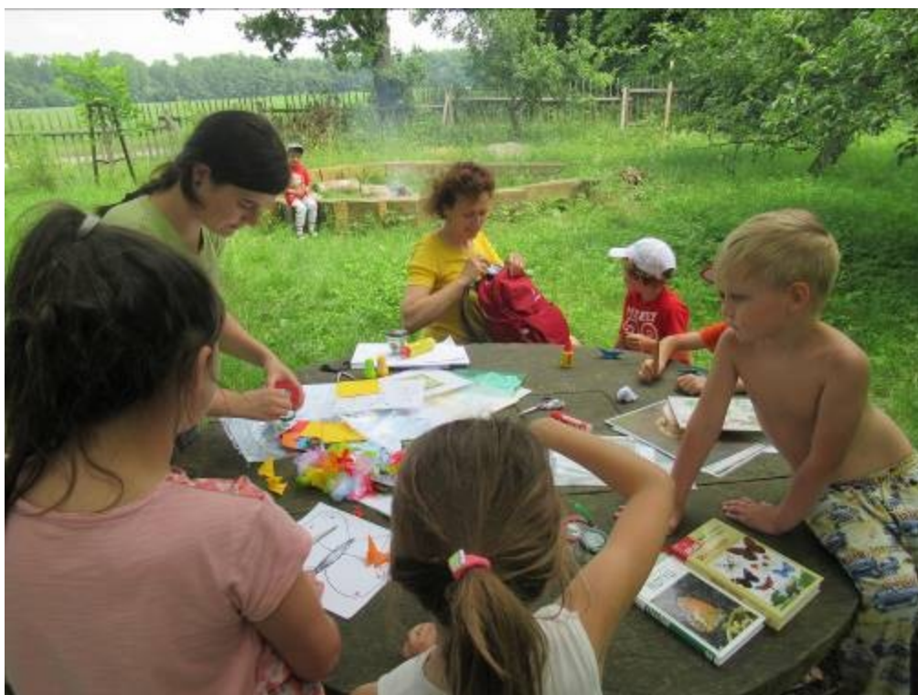
Stanoviště – motýli.

Při tomto programu si návštěvníci vyzkoušeli lov motýlů pomocí sítky v rámci ovocného sadu v blízkosti Šargounu. Byla jim prezentována vědecká metoda značení motýlů při studiu početnosti jejich populací. Účastníci byli seznámeni s životním cyklem motýlů a pomocí lepení těstovin si prezentovali cyklus na papíru. Z pedigu si také vyrobili svého vlastního motýla. Dále byl prezentován život včel medonosných a včel samotárek. Návštěvníci si mohli vyrobit základ pro svůj vlastní hmyzí hotel. Nakonec programu byla připravena objevná stezka úkolů, kdy po zodpovězení otázek o přírodě CHKO Litovelské Pomoraví se našel poklad.