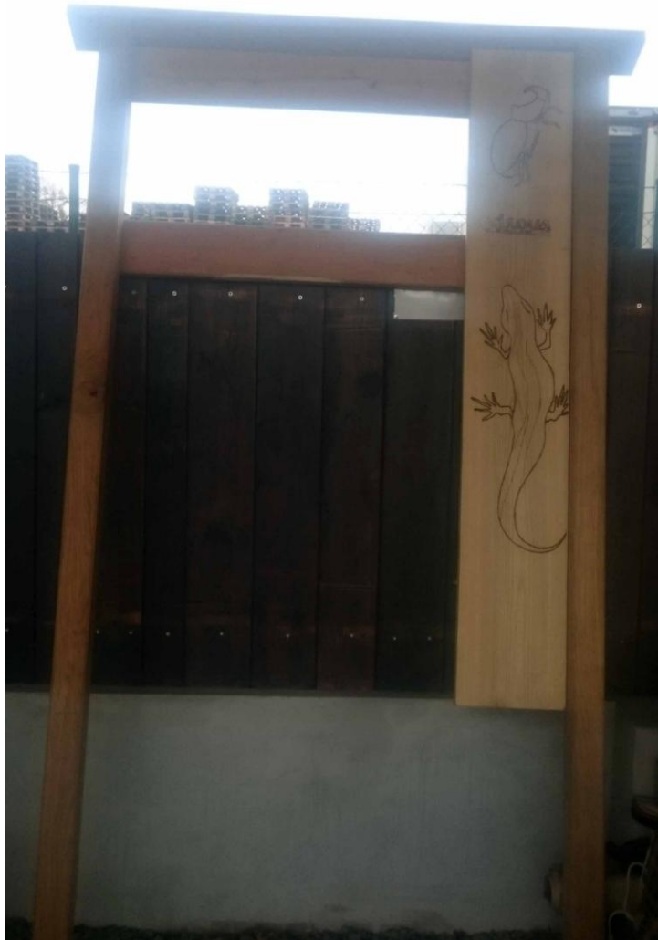
Vzhled informačního stojanu